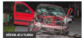
OČEVID JE U TIJEKU

FOTO U Kućanu se zaletio u ogradu kuće, pa završio na drugoj strani kolnika